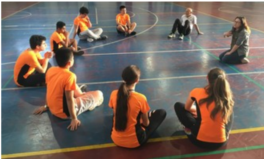
Interventi sulla Psicofisica