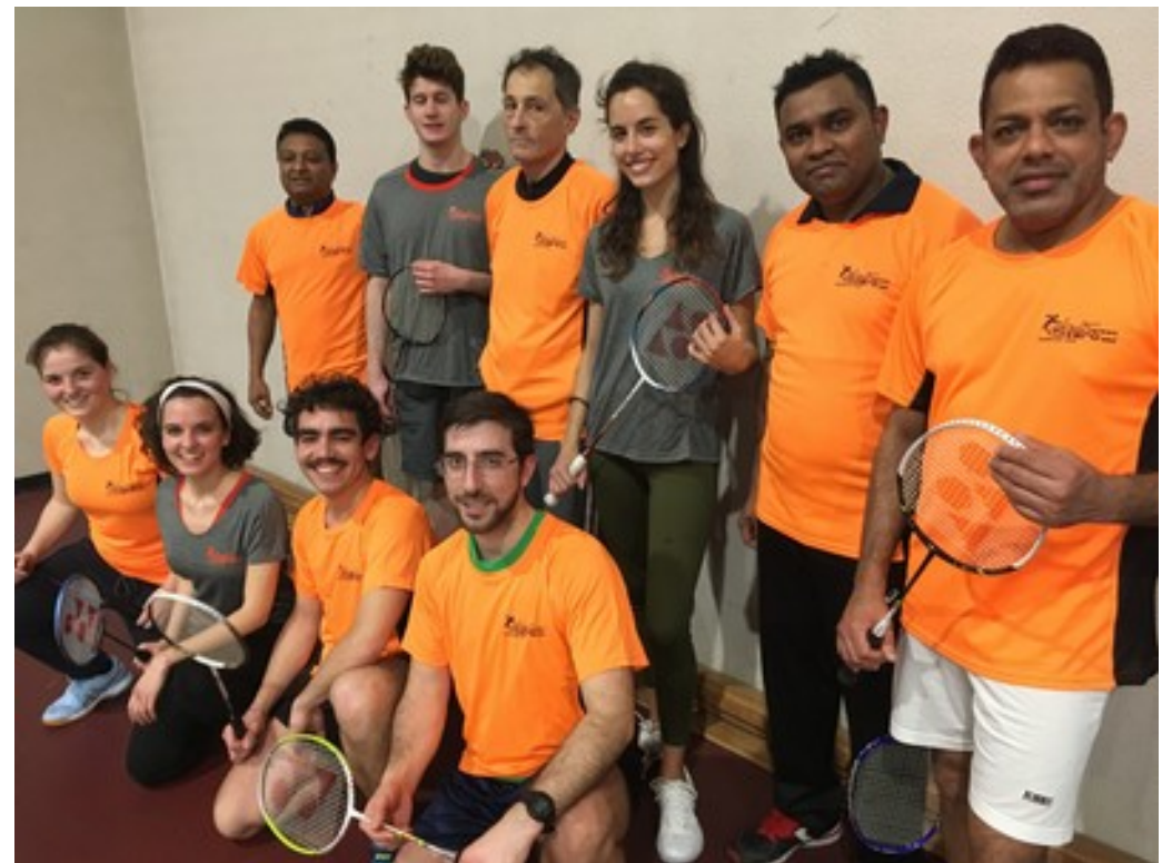
le nuove maglie !!!